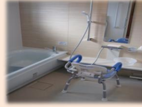
お一人ずつの入浴