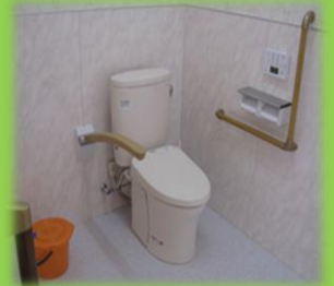
広々トイレスペース