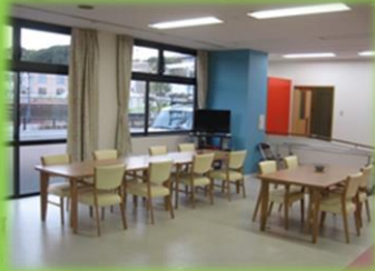
食事・談話コーナー