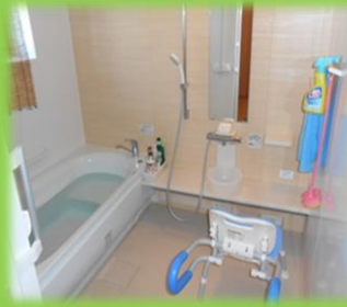
お一人ずつの入浴