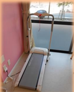
ルームランニング