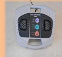
フットマッサージ